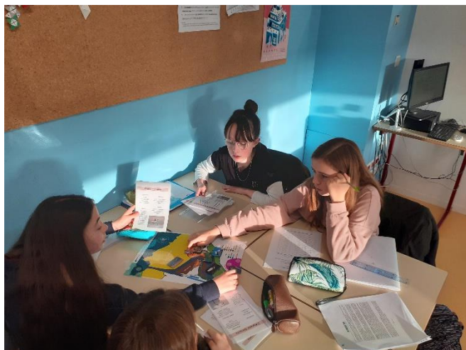
Animation adapto en classe du jeu